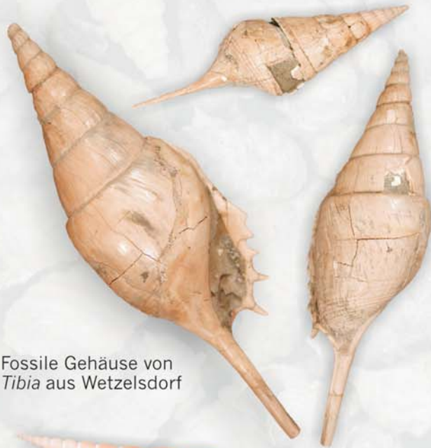
Fossile Gehäuse von Tibia aus Wetzelsdorf

Sie ist durch ihre Form mit dem extrem verlängerten "Schnabel" und die Stacheln an der Mündung, die ein Einsinken verhindern, an ein Leben auf dem weichen, schlammigen Meeresboden angepaßt.